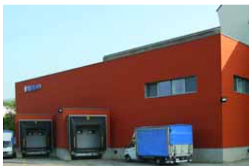
Für die Farbtönstabilität wurde die Fassade nach drei Jahren komplett neu beschichtet

Glasfassade nach Außen und in das Foyer hinein. Hier bildet eine in Gelbtönen lasierte Wand den strahlenden Hintergrund und einen Kontrast zu der schwarzen Treppe und dem fast ebenso dunklen Steinfußboden. Tagsüber fällt natürliches Licht auf die Wand. Nachts sind es Licht und Farbe verbindende LEDs, die den Raum atmosphärisch verwandeln: Zwei gläserne Elemente, der Empfangstresen und eine Wand über zwei Geschosse, leuchten in Blau, Rot oder Gelb. Die beiden Stirnseiten des Foyers schließen rot bzw. blau an die folgenden Baukörper an.